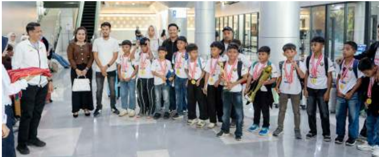
ROMBONGAN tim juara Sport Academy PSM Poboya U11 disambut di Bandara oleh KONI Sulteng.