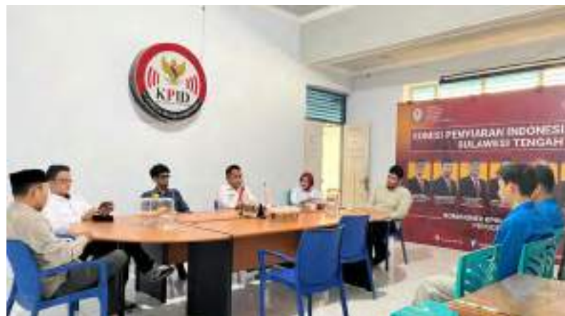
SETELAH menjalani masa magang selama empat bulan, tiga mahasiswa Untad Palu secara resmi ditarik oleh pihak kampus, Rabu (8/7/2026).

ini sebagai ajang menambah wawasan dan mempelajari hal-hal yang tidak ditemukan di ruang kelas. KPID selalu terbuka bagi mahasiswa yang ingin belajar, melakukan penelitian, maupun berkontribusi melalui berbagai kegiatan akademik lainnya,"