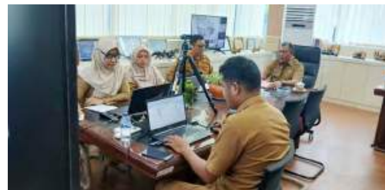
RAPAT Dinas Perkimtan Sulteng membahas percepatan pelaksanaan program perbaikan RTLH.

Huni (RTLH) ke aplikasi My PKP, Sulteng dengan target 5.977 unit untuk memenuhi kuota Provinsi