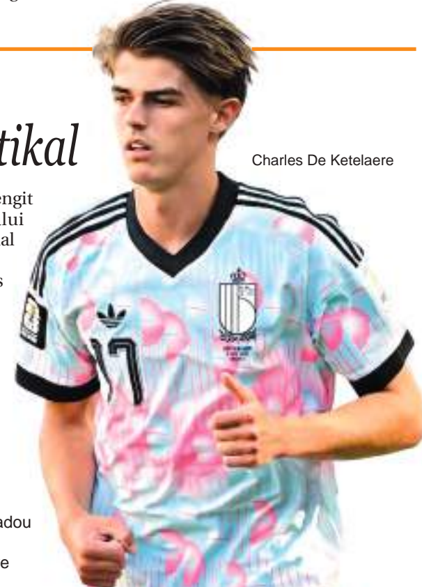
Charles De Ketelaere

Belgia (4-2-3-1): Thibaut Courtois; Timothy Castagne, Brandon Mechele, Nathan Ngoy, Maxim De Cuyper; Amadou Onana, Youri Tielemans; Jeremy Doku, Nicolas Raskin, Leandro Trossard; Charles De Ketelaere Pelatih: Rudi Garcia