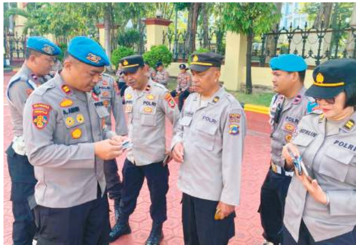
PROFESI dan Pengamanan (Propam) Polresta Palu kembali melaksanakan pemeriksaan kelengkapan administrasi dan perlengkapan diri personel di Mapolresta Palu, Rabu (8/7/2026).

Kegiatan tersebut merupakan agenda rutin yang dilaksanakan Seksi Propam Polresta Palu sebagai bentuk pengawasan internal sekaligus upaya pembinaan terhadap personel agar senantiasa mematuhi aturan dan menjaga disiplin dalam pelaksanaan tugas. ***