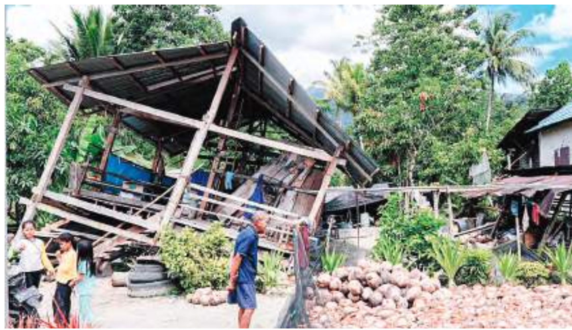
SALAH satu rumah warga di Desa Kamarora, Kecamatan Nokilalaki, Kabupaten Sigi yang rusak akibat gempa bumi beberapa waktu lalu.

Ia mengemukakan sudah memerintahkan Camat Nokilalaki dan Palolo melakukan uji publik dengan melibatkan masing-masing kepala desa di daerah tersebut. "Apabila tidak ada lagi sanggahan dari hasil uji publik ini, maka