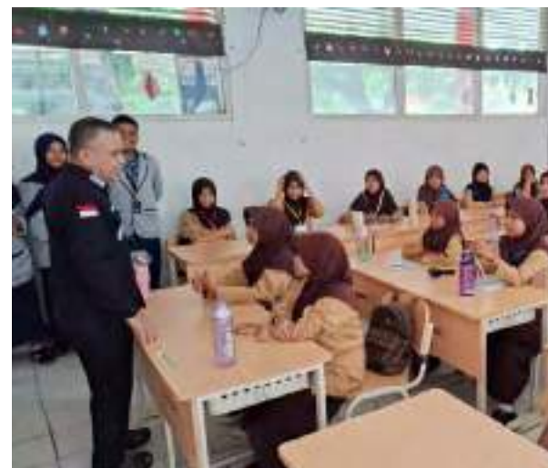
WALI Kota Palu, Hadianto Rasyid saat memantau pelaksanaan SPMB dan MPLS di SMPN 3 Palu, Rabu (8/7/2026).

Wali Kota menegaskan Pemerintah Kota Palu siap mendukung pelaksanaan penelitian tersebut melalui penyediaan data, fasilitasi koordinasi dengan perangkat daerah, serta menghubungkan tim peneliti dengan berbagai pemangku kepentingan yang berkaitan dengan pengembangan tenun daerah. Ia berharap hasil penelitian dapat menjadi dasar penyusunan kebijakan yang mendorong peningkatan daya saing produk tenun di pasar nasional maupun internasional. UM