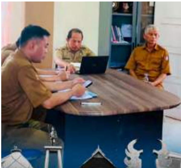
RAPAT evaluasi kinerja Disperindag Sigi, Selasa (7/7/2026). FOTO: DOK. DISPERINDAG SIGI

SIGI, MERCUSUAR – Dinas Perindustrian dan Perdagangan (Disperindag) Kabupaten Sigi menggelar rapat evaluasi kinerja, sebagai upaya meningkatkan efektivitas pelaksanaan program dan tata kelola organisasi.