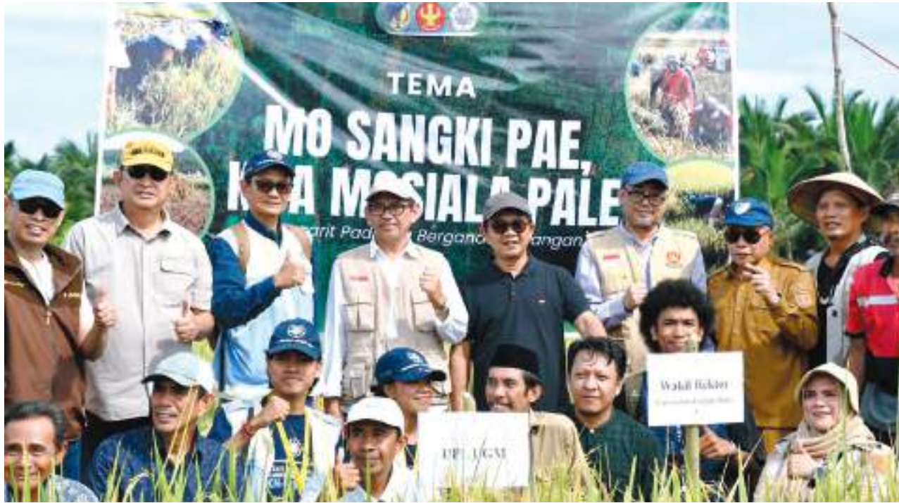
UNIVERSITAS Tadulako (Untad) dan Universitas Gadjah Mada (UGM) melaksanakan monitoring dan evaluasi (monev) Kuliah Kerja Nyata (KKN) Kolaboratif di Desa Limboro dan Desa Towale, Kecamatan Banawa Tengah, Kabupaten Donggala, Selasa (7/7/2026).

TONDO, MERCUSUAR – Universitas Tadulako (Untad) dan Universitas Gadjah Mada (UGM) melaksanakan monitoring dan evaluasi (monev) Kuliah Kerja Nyata (KKN) Kolaboratif di Desa Limboro dan Desa Towale, Kecamatan Banawa Tengah, Kabupaten Donggala, Selasa (7/7/2026).