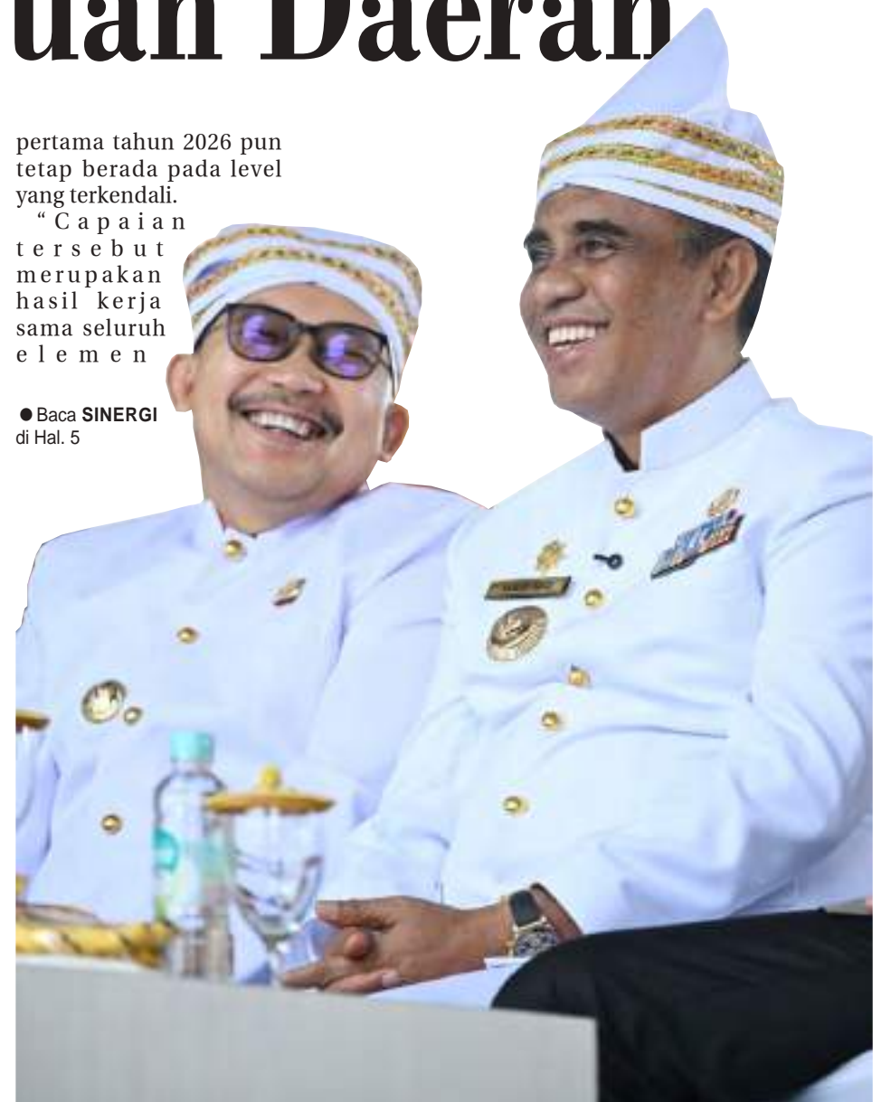
GUBERNUR Sulteng, Anwar Hafid (kanan) bersama Bupati Banggai, Amirudin, pada peringatan HUT ke-66 Kabupaten Banggai, di Luwuk, Rabu (8/7/2026).