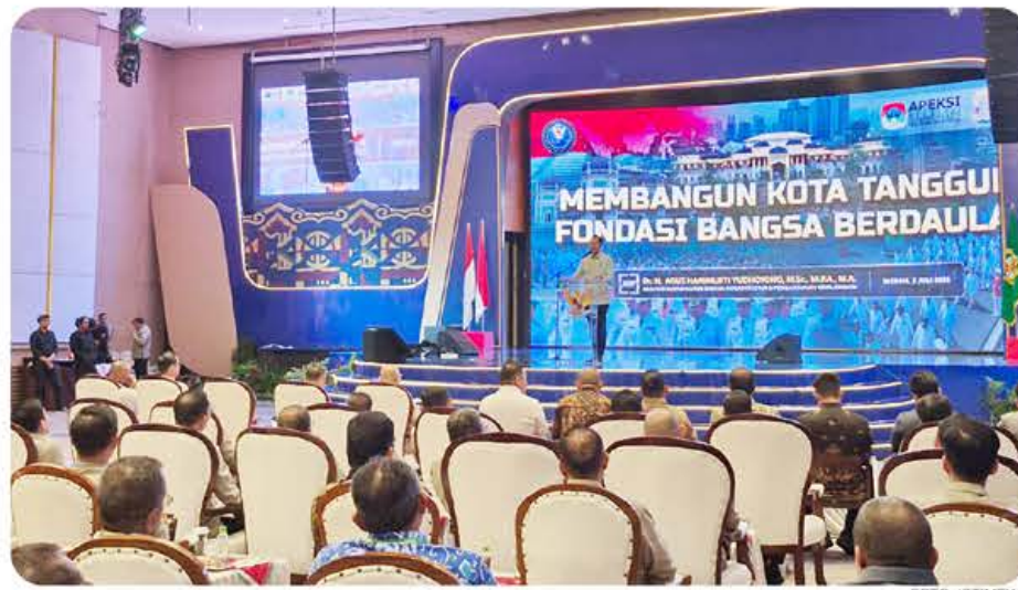
MOMENTUM: Menteri AHY membawakan materi di forum APEKSI yang diikuti langsung Wali Kota Bitung Hengky Honandar.

Bagi Wali Kota Bitung, materi yang disampaikan Menteri AHY menjadi bekal yang sangat berharga dalam merumuskan