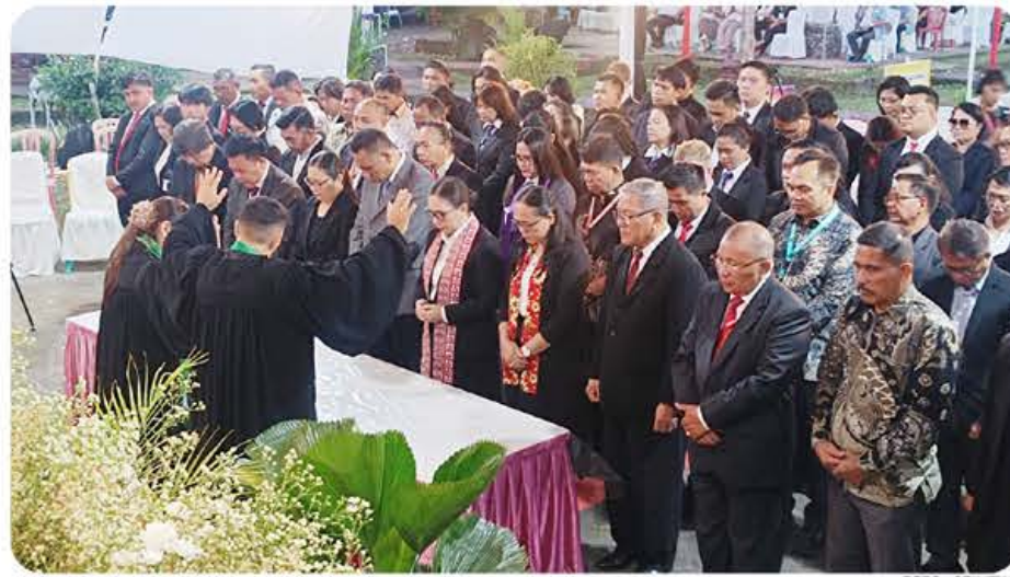
SELAMAT MELAYANI: Pelantikan dan penguhan Pimpinan Gereja KGPM Periode 2026-2031 dalam Sidang Raya ke 35 yang berlangsung di Kiawa Resort.