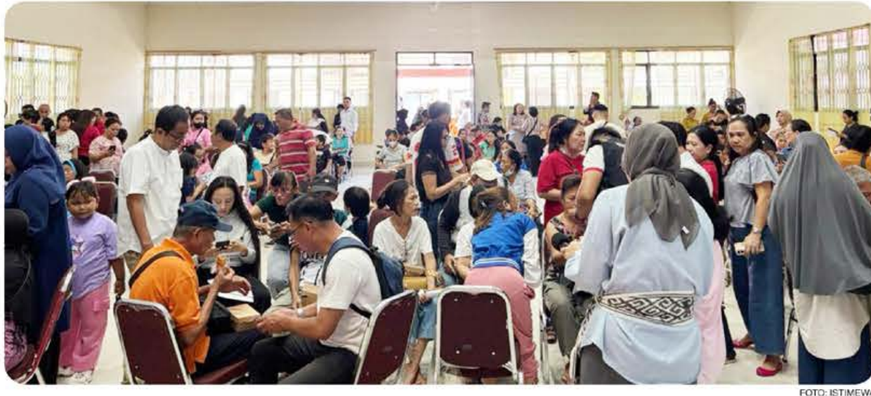
ANTUSIAS: Nampak masyarakat yang mengikuti uji coba terbatas digitalisasi bansos di Kecamatan Tikala, Jumat pekan lalu.

Agen-agen pendamping tersebut berasal dari gabungan ketua-ketua lingkungan, lurah, pendamping PKH, ASN Dinas Sosial, ASN Dinas Komunikasi dan Informatika (Diskominfo) dan ASN Dinas Kependudukan dan Pencatatan Sipil (Disdukcapil). "Ini uji coba kepada masyarakat calon penerima bansos. Kita akan daftarkan pada saat ini. Bagi masyarakat yang belum mengaktifkan Identitas Kependudukan Digital (IKD), proses aktivasi akan dibantu oleh Disdukcapil. Sementara itu, bagi masyarakat yang tidak memiliki telepon seluler, maka bisa memanfaatkan pendampingan dari para agen untuk melakukan