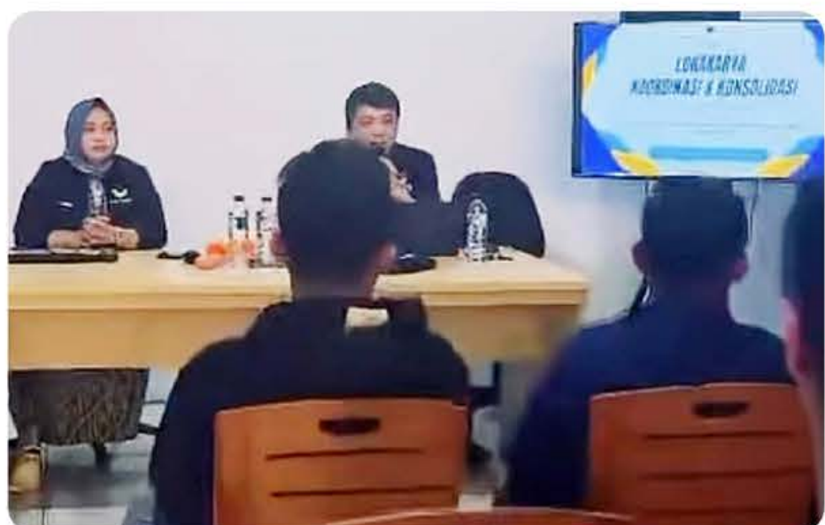
PERDANA: Rapat konsolidasi DPD Partai Nasdem yang pertama pasca Plt Ketua yang baru.

Diketahui, untuk opening ceremony PSR Sinode GMIM 2026 akan dilaksanakan, Selasa 28 Juli 2026 pukul 16.00 WITA di Aula Mapalus, Kantor Gubernur Sulawesi Utara. Sementara, untuk closing ceremony sekaligus penyerahan hadiah dilaksanakan 8 Agustus 2026 pukul 17.00 WITA di Atrium Manado Town Square 3. (Iak)