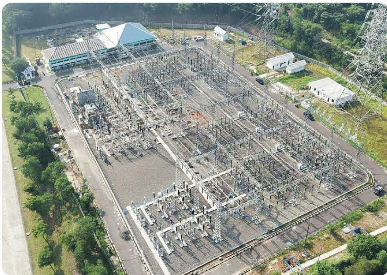
NADI KELISTRIKAN: Gardu Induk 150 kilovolt (kV) Margakarya di Karawang International Industrial City (KIIC), Jawa Barat.

Untuk Triwulan III tahun 2026 parameter yang digunakan merupakan realisasi periode Februari-April 2026 yang mencatat kurs sebesar Rp16.959,32 per USD, ICP sebesar USD96,12 per barel, inflasi 0,21 persen, dan HBA sebesar USD70 per ton (sesuai kebijakan Domestic Market Obligation/DMO batubara). Meski secara formula terdapat potensi perubahan tarif, Pemerin-