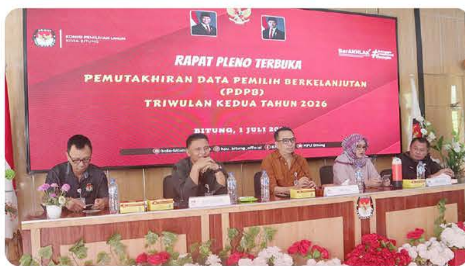
KOMITMEN: Rapat pleno terbuka rekapitulasi PDPB Triwulan II Tahun 2026.

BITUNG - Komisi Pemilihan Umum (KPU) Kota Bitung resmi menetapkan sebanyak 162.122 pemilih dalam rapat pleno terbuka rekapitulasi Pemutakhiran Data Pemilih Berkelanjutan (PDPB) Triwulan II Tahun 2026, di Aula Kantor KPU Kota Bitung, pekan lalu.