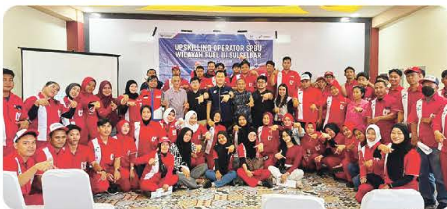
UPDATE SKILL: operator dan pengawas SPBU Fule III Sulselbar mengikuti kegiatan Upskilling bersama Pertamina dan Hiswana Migas.

ingin memastikan operator selalu mengikuti perkembangan regulasi, memiliki kemampuan memberikan pelayanan yang profesional, serta mampu menangani masukan maupun keluhan