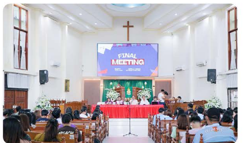
MATANGKAN: Ketua Panitia mengikuti Final Meeting Pesta Seni Remaja yang digelar di GMIM Bethesda Ranotana, Sabtu (4/7).

Agenda tersebut merupakan momentum untuk menyamakan persepsi, sekaligus memfinalisasi berbagai aspek teknis sebelum pelaksanaan PSR.