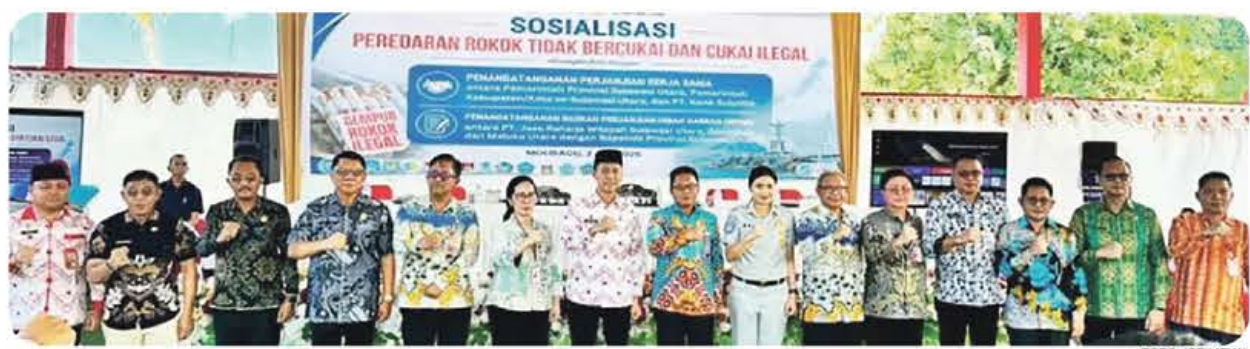
KOLABORASI: Pemprov Sulut bersama pemerintah Kabupaten/Kota menandatangani PKS untuk sinergi NPHD bersama BSG, beberapa waktu lalu.

"Kami mengapresiasi langkah Pemerintah yang tetap menjaga stabilitas tarif listrik pada Triwulan III tahun 2026 dan siap menjalankan kebijakan ini. PLN berkomitmen untuk terus menjaga keandalan pasokan listrik dan kualitas layanan, sehingga kebijakan dari Pemerintah dapat dirasakan langsung dampaknya oleh masyarakat luas serta menjadi motor penggerak roda perekonomian domestik," ujar Darmawan. (*)